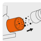
Puerto para extracción