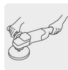
Mango lateral para mayor comodidad y control