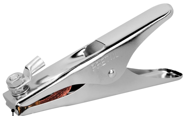
Mordaza de latón