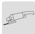
Para esmeriladora angular